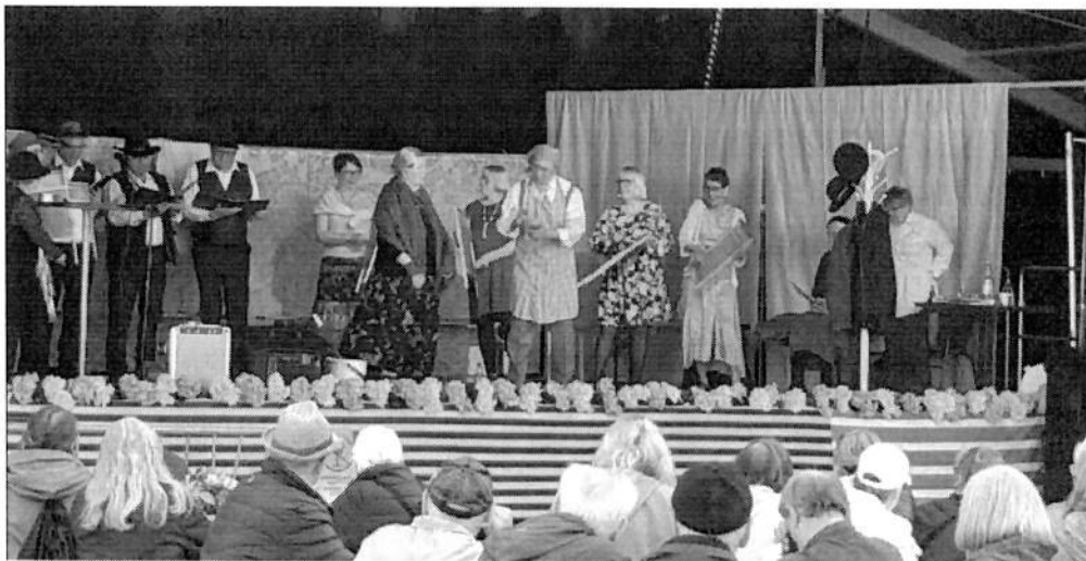
Kuva 1. Kevät Kimara-tapahtuma torilla toukokuussa 2022.

Myös kaikille avointa kulttuuritapahtumatoimintaa saatiin käynnistettyä vuoden 2022 aikana. Toukokuussa järjestettiin torilla kulttuuriväärtiesiintyjien toimesta ns. Kevät Kimara – tapahtuma, jossa oli elävää musiikkia ja näytelmä. Tapahtumaan osallistui 180 henkilöä. Kevät Kimara -tapahtumasta kerätyn osallistujapalautteen (n83) mukaan tällaiset tapahtumat ovat tärkeitä (96 %:a vastanneista.) Vastanneista 89 % koki tällaisten tapahtumien tukevan omaa jaksamistaan.